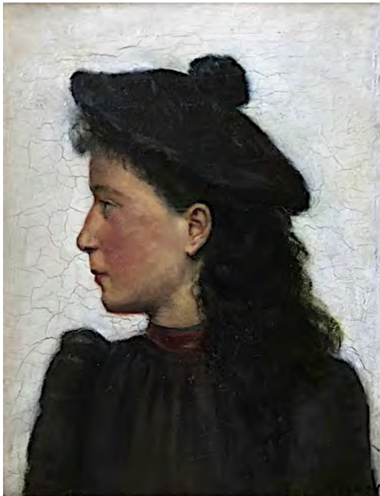
Jacoba van Heemskerck, Zelfportret , ca. 1890-1894/97, olieverf op paneel, 23 x 18 cm / 47 x 43 cm, part. collectie.